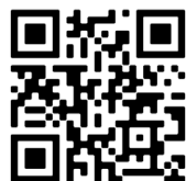
Escanear el código